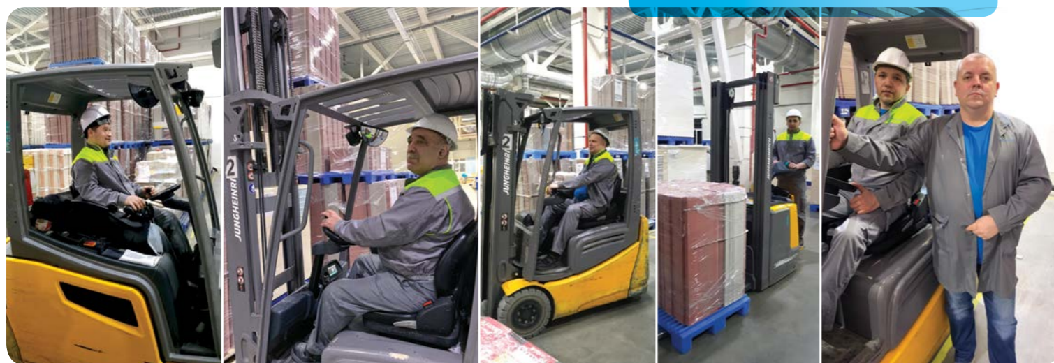
Команда отдела в работе

Благодаря им каждая паллета с полуфабрикатом на своём месте. Для облегчения навигации полуфабриката по производству в 2021 году предусмотрена автоматизация процессов. И тогда благодаря автоматизированному учёту, как на складе хранения готовой продукции, например, под контролем будет каждая паллета.